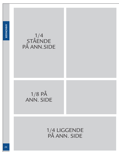
ANNONSEFORMAT HELSIDE MED SMÅANNONSER